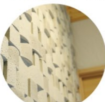
お茶殻のリサイクルで出来た内装材。抗菌や消臭効果にも優れているので部屋を快適にしてくれます。立体的で質感豊かなデザイン。