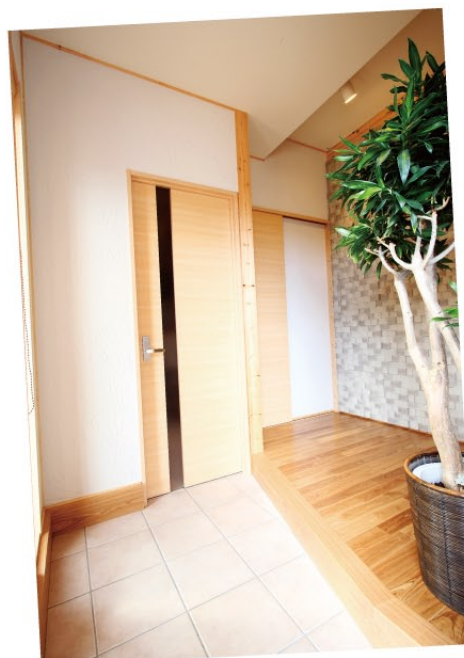
玄関横の土間収納は 棚付きの大容量で玄関廻りがすっきり。