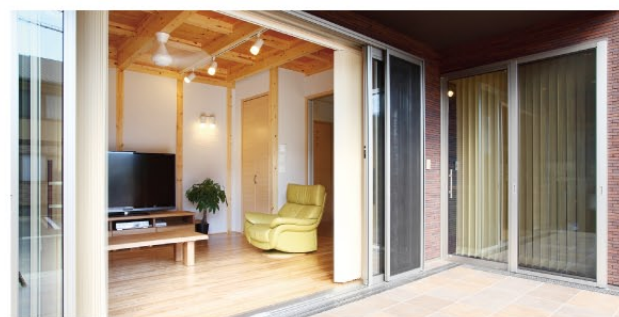
テラスはリビングの床とフラットにする事で、外へ繋がる大きな空間に。