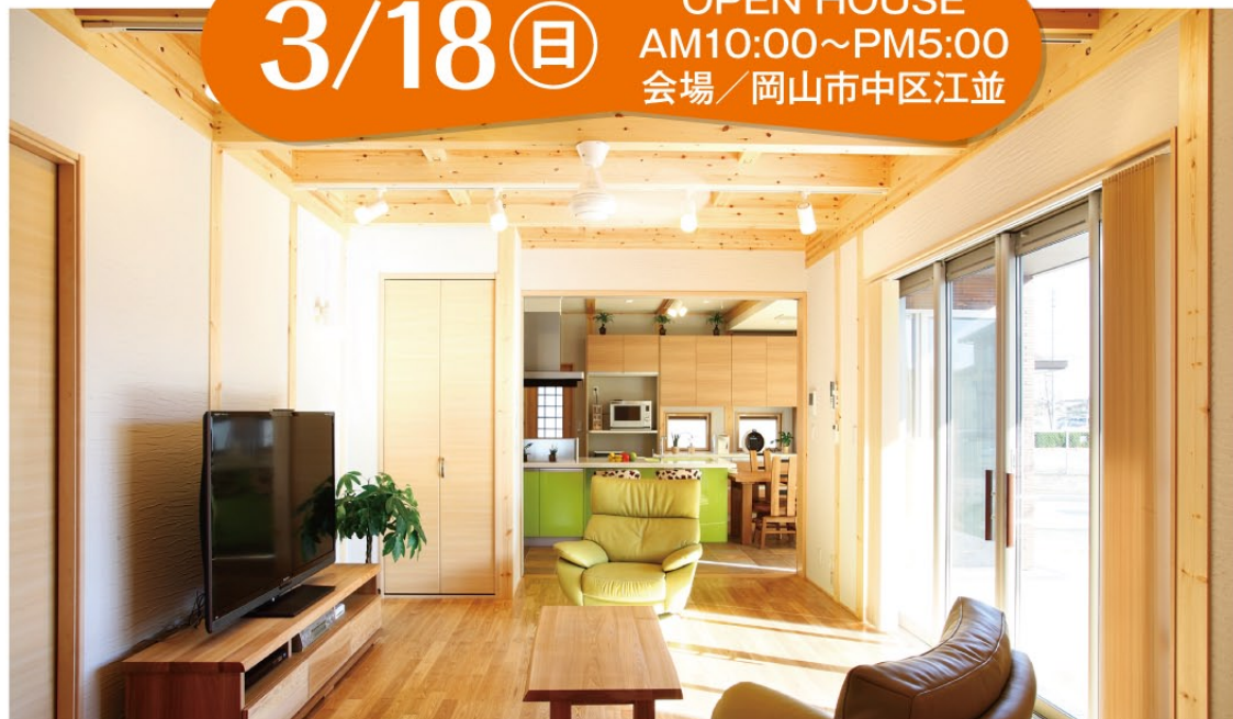
温かい陽光が差し込み、木の美しさが引き立つ明るいリビング。